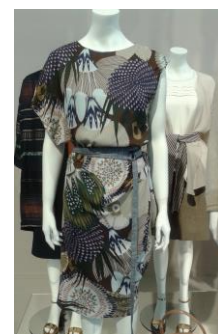
Collectie Oilly zomer 2016

Voor andere workshops, info. en opgave zie: S-Kwadraat In overleg is veel mogelijk! (oa. data, locatie en groepen vanaf 4-8 personen)